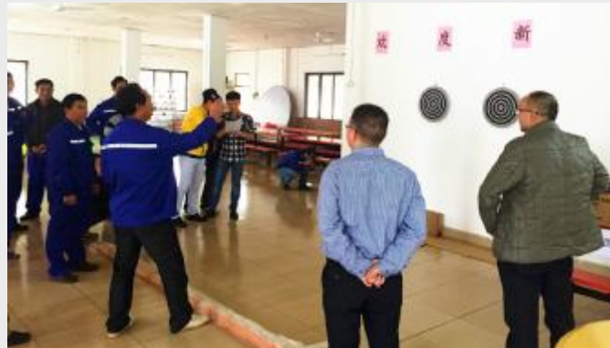
雷州项目部举办新春游园活动，包括投飞镖、套圈图等一系列比赛活动，吸引广大员工积极参与。