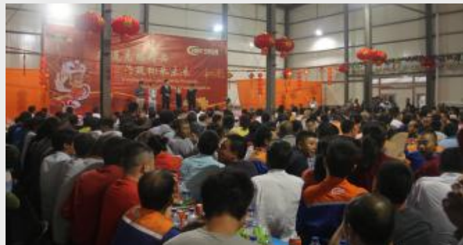
纳米比亚项目部举办新年联欢晚会，精心编排特色节目，其乐融融共聚传统新春佳节。