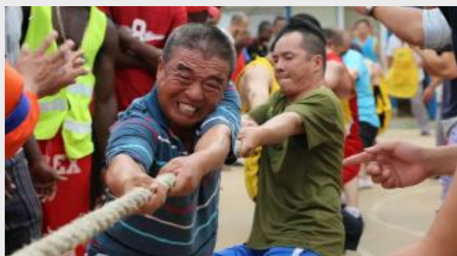
安哥拉项目部组织了拔河比赛、套圈儿以及文艺晚会等活动，为员工呈上精彩绝伦的文化盛宴。

见的文化活动。本次活动较大丰富了员工的业余文化生活，有效缓解海外项目游子的思国思乡之情，增强项目团队的凝聚力和向心力，共度一个和谐美满的新年，树立“身心健康，快乐阳光”理念，以更饱满的热情和更充足的干劲迎接2016年的到来。（综合报道）