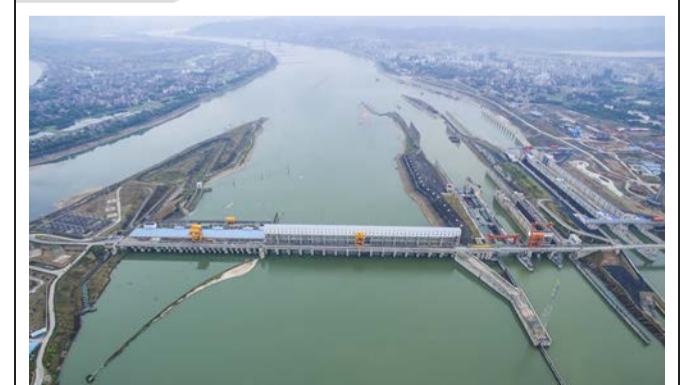
长洲水利枢纽三线四线船闸