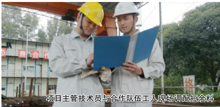
项目主管技术员与合作队伍工人现场调配短余料

“没想到你们能把效能监察与物资管理结合，做得这么出色！”在四航局召开的效能监察工作交流会上，公司珠海城际项目部创造性的结构钢筋效能监察工作获得了领导的一致好评。