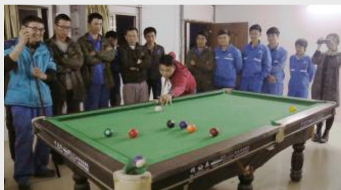
四分公司围绕“宏图开玉宇·盛世显金猴”主题，举行了台球、羽毛球等系列文体比赛活动。