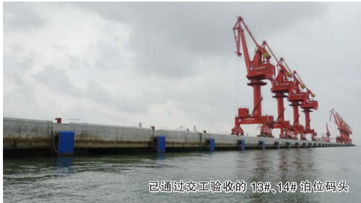
已通过交工验收的 13#、14# 泊位码头

“这在广西地区水工工程建设中实属罕见”，2015年12月8日，在交工验收会上，钦州项目部承建的钦州港金鼓港区勒沟作业区 13#-14# 泊位码头以观感质量 90.6% 的高分（满分为 95%）得到广西壮族自治区质监站、业主等单位的高度评价。