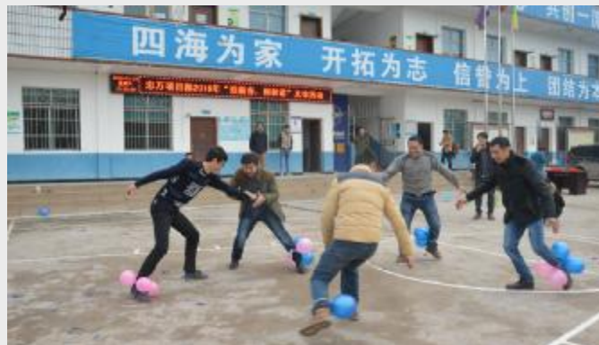
忠万项目部以“迎新春，创和谐”为主题，举办了一场别开生面的趣味体育活动。